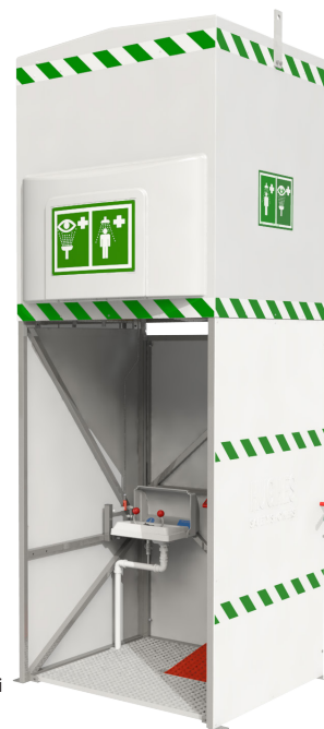
Naobrázku volitelným sklolaminátovými panely a oční sprchou

Integrovaný ponorný ohřivač a silná polyuretanová izolace udržují teplotu vody v horní nádrži v rozmezí 15 až 38 °C (59 až 100 °F). Při této vlažné teplotě může zraněný zůstat pod sprchou doporučených 15 minut, aby se důkladně dekontaminoval.