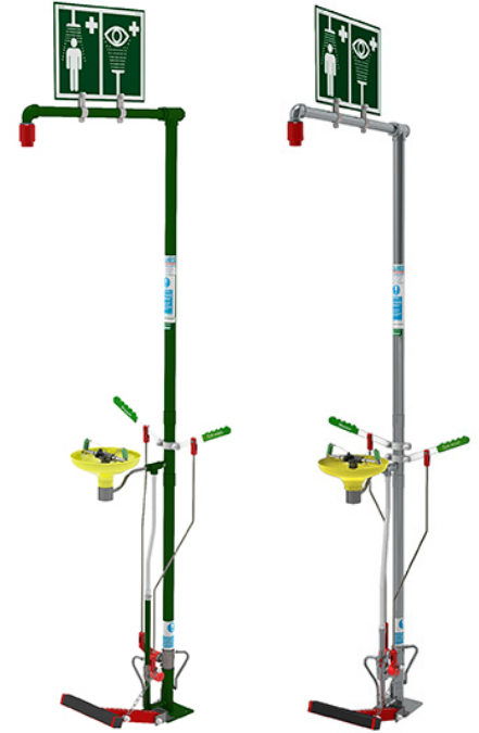
Se muestra con un cartel y un pedal opcionales

El lavaojos amarillo de alta visibilidad está fabricado con plástico ABS duradero para resistir la corrosión en entornos difíciles. Las cubiertas antipolvo protegen las boquillas de la suciedad y los residuos. Cumple con las normas ANSI Z358.1-2014.