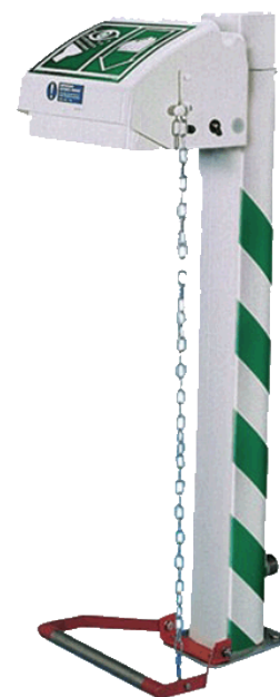
Illustrata con il pedale facoltativo

Installa questo lavaocchi/viso su piedistallo entro 10 secondi di distanza da una zona potenzialmente a rischio. Questo modello è dotato di un rivestimento esterno in polietilene anti-impatto a media densità ed è pre-isolato in modo da proteggere le tubature dagli effetti del gelo o della luce solare diretta. L'ABS rivestito in acrilico garantisce ulteriore protezione alla vaschetta e ai diffusori contro gli agenti contaminanti esterni. Questa unità è conforme agli standard EN 15154 e ANSI Z358.1-2014.